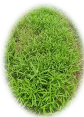
ผักบุ้งจีน