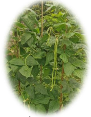
ถั่วฝักยาว