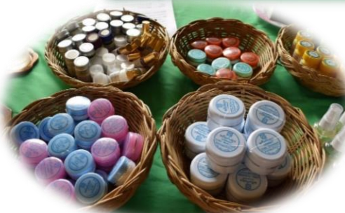
(งานการศึกษา)